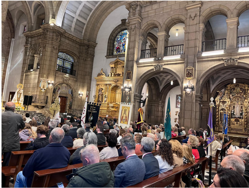
Arriba un momento de la celebración de la misa en la parroquia de San José. Abajo, a la derecha el Delegado Episcopal de Piedad Popular junto a la Alcadesa de Gijón y el Hermano Mayor de la Cofradía de Nuestra Señora del Carmen de Gijón.

Es importante valorar esta dedicación y que se sientan acogidas y respaldadas para que esas brasas sigan presentes.