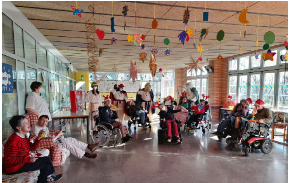
Los Reyes Magos visitaron ASPACE esta Navidad, donde fueron recibidos con la mayor alegría.

La hermandad de la Santa Misericordia de