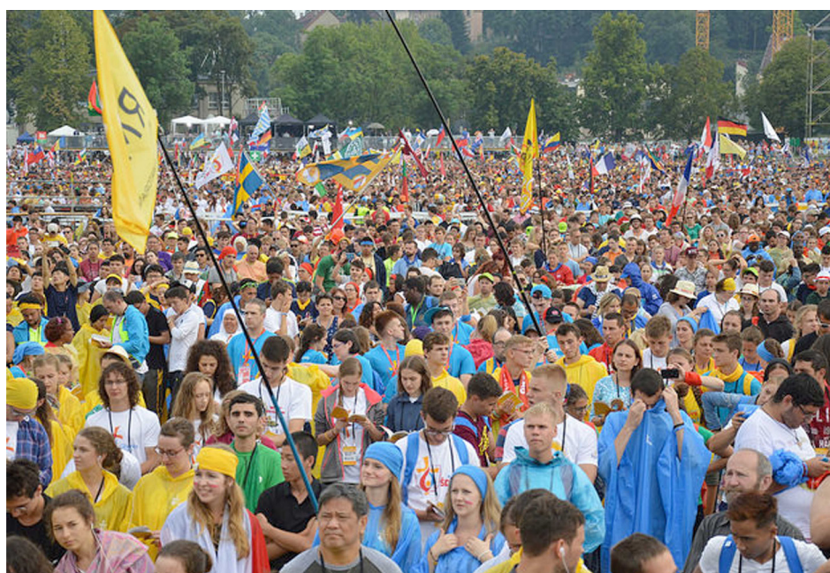
Arriba, una instantánea de la JMJ de Toronto (2002). Sobre estas líneas, JMJ de Cracovia (2016).

suelen ser caras —explica el Delegado—. Los jóvenes habitualmente se organizan para hacer actividades, conseguir dinero y así poder sufragar una parte de los gastos. En mi parroquia, por ejemplo, han hecho muchas actividades en Navidad. Y lo hacen entre todos, no solo los que van, sino los que se quedan aquí también ayudan. Y es que los diez días