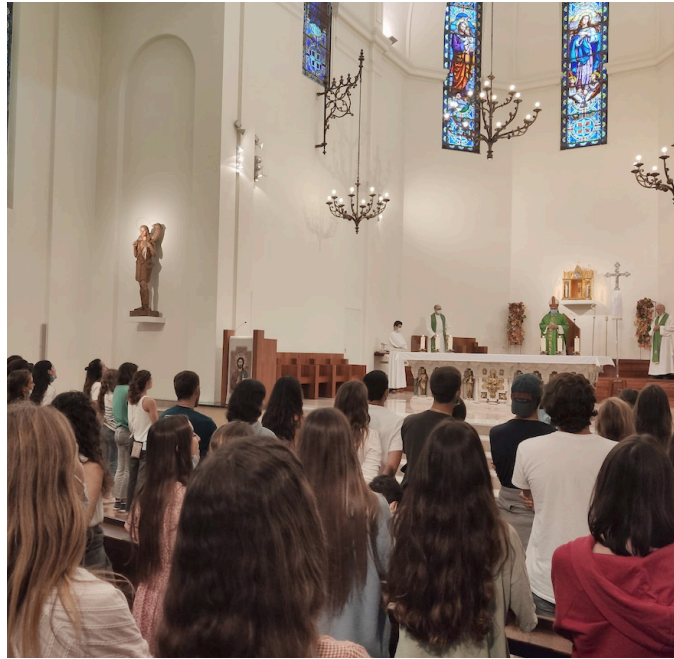
Hakuna en una visita a Asturias en el año 2021.

Con este motivo, los jóvenes llegarán a Covadonga el viernes, donde comenzarán su encuentro con una Hora Santa y adoración al Santísimo. El sábado arrancarán el día con la eucaristía en la Santa Cueva y posteriormente subirán a los Lagos, donde pasarán la mayor parte del día, para finalizar de