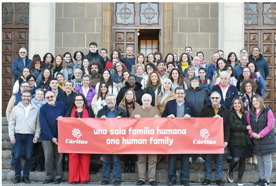
Un momento del encuentro, hoy en el Seminario Metropolitano

→ “En este contexto haremos también una mención especial a todas las personas migrantes. En este domingo en el que celebramos la Jornada Mundial de los Pobres, el Papa Francisco hace especial hincapié en todas aquellas personas que, por circunstancias diversas, se ven obligadas a abandonar su tierra y sus hogares”, explica el Secretario General de Cáritas diocesana. “Que-