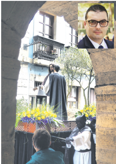
Imagen de la cofradía El Beso de Judas.

Sin duda, para mí en Avilés hay dos momentos especialmente emotivos: el Miércoles Santo, el Día del Encuentro en la plaza del Ayuntamiento; y el Viernes Santo, cuando procesionamos todas las cofradías juntas, acompañando al Cristo Yacente.