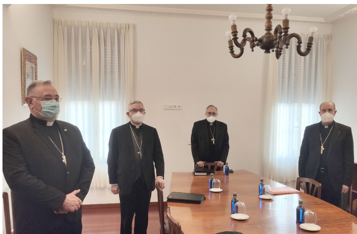
Los obispos de la Provincia Eclesiástica de Oviedo en el Seminario Metropolitano.

La jornada comenzó con una oración conjunta, y a lo largo de la mañana se desarrollaron diferentes reuniones, primero entre los obispos, analizando la reciente visita Ad Limina a Roma, aportando las impresiones del evento, y donde tuvieron la ocasión de encontrar-