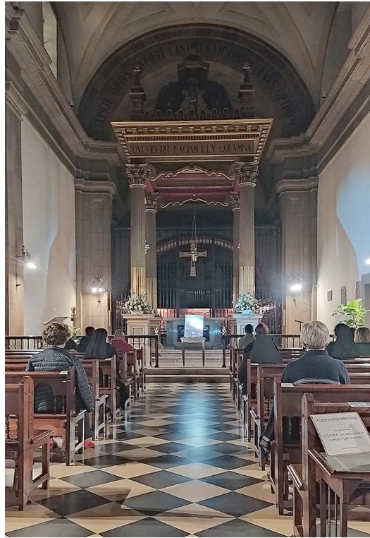
Un momento de Ora 30', todos los lunes en el monasterio de San Pelayo de Oviedo