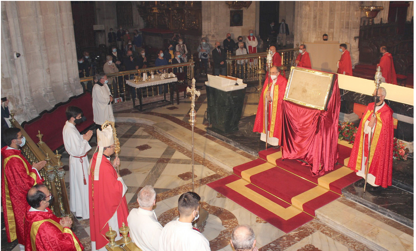
Un momento de la misa jubilar en la Catedral, este pasado miércoles, 15 de septiembre.