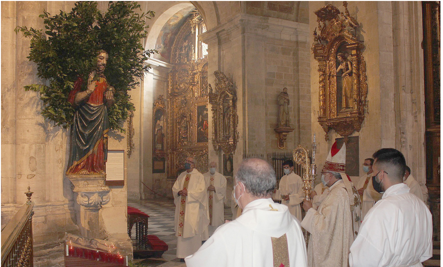
Fiesta de El Salvador, titular de la Catedral, el pasado 6 de agosto.