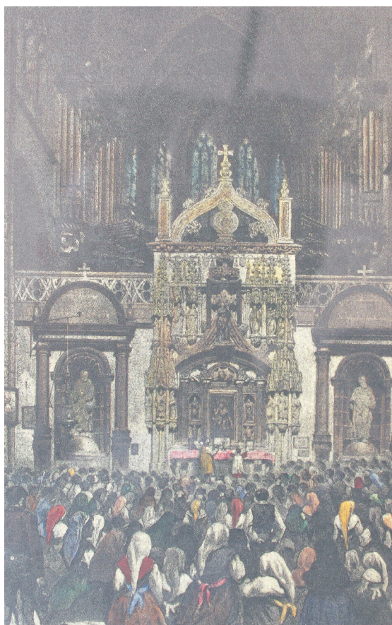
Grabado antiguo de la Catedral.

La reliquia del Santo Sudario es la reliquia mejor guardada, la más querida por nosotros, porque envolvió el rostro de Jesús al