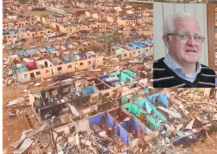
Imágenes aéreas que muestran la zona afectada por la grave explosión en Bata.

só con todo. Conozco gente que ha perdido hasta a siete miembros de su familia. Además de militares muertos, también hubo muchas personas del arrabal, gente que había abandonado el campo y se iba a vivir a la ciudad.