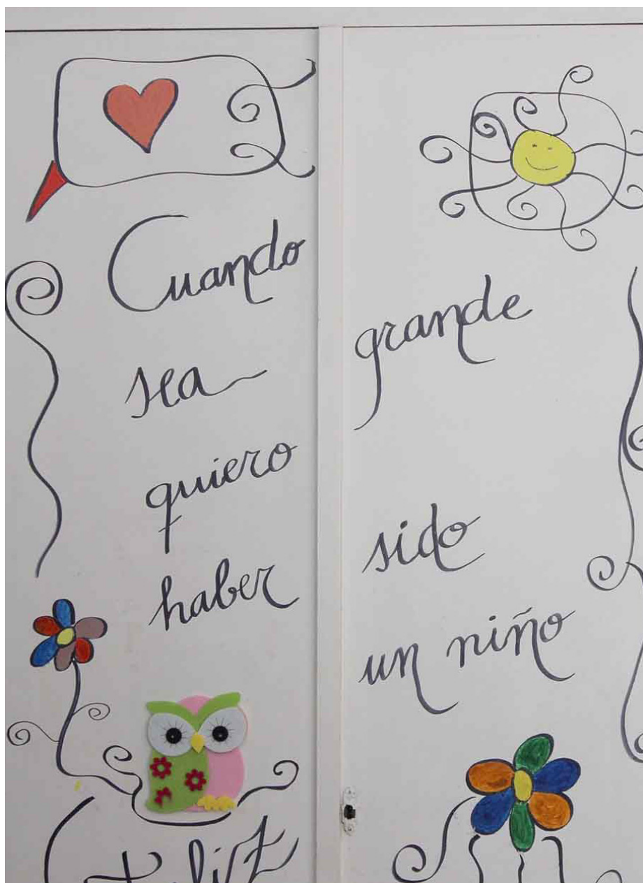
Un armario decorado en el colegio diocesano Sagrada Familia (Oviedo).

En la misma línea se manifestaron los obispos de la Conferencia Episcopal Española, desde la Comisión Episcopal para la Educación y Cultura, en una nota publicada el pasado 17 de junio. “El Proyecto de Ley de Educación que ha sido publicado en circunstancias tan extraordinarias como las de un estado de alarma –recordaban en su nota los obispos– afecta sin duda a toda la sociedad, verdadera protagonista de la educación, de la que formamos parte como