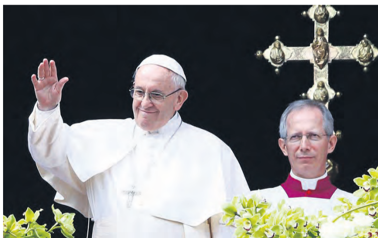
Ángelus del Papa Francisco el 1 de enero en la Plaza de San Pedro.

quier precio lleva al abuso y a la injusticia”. Por eso, aunque la política es un “vehículo fundamental para edificar la ciudadanía y la actividad del hombre”, cuando “aquellos que se dedican a ella no la viven como un servicio a la comunidad humana, puede convertirse en un instrumento de opresión, marginación e incluso destrucción”. El Pontífice animó a que cada uno aporte “su propia piedra para la construcción de la casa común” y