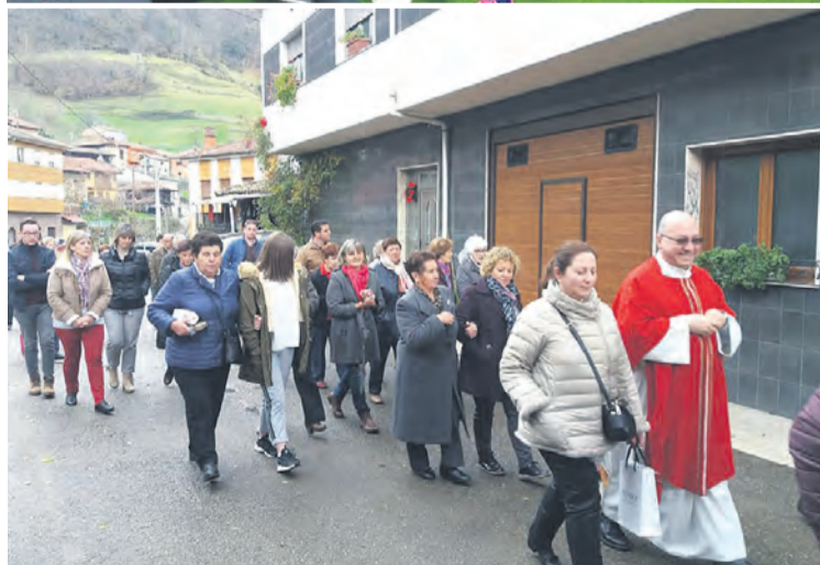
Sobre estas líneas, celebración de la Virgen de Otero, el 15 de agosto; a la izquierda, Holywins con los más pequeños, en Pola de Laviana, el 1 de noviembre; debajo, procesión de Santa Eulalia en La Ferrera, el 10 de diciembre.

nueve parroquias y teníamos, por así decirlo, la misa a la carta. Ahora tenemos dos sacerdotes para las nueve parroquias y se sigue queriendo lo mismo, especialmente en verano, durante las fiestas de los pueblos –asegura–. Intentamos explicarles que no siempre es posible que la misa sea a las 12, porque todos quieren siempre la misa a esa hora para no madrugar, y con todo el dolor de corazón, qué más quisiéramos que todas las misas fueran a las 12 los domingos, pero no puede ser, y hay que mentalizarse y responsabilizarse de esta realidad”.