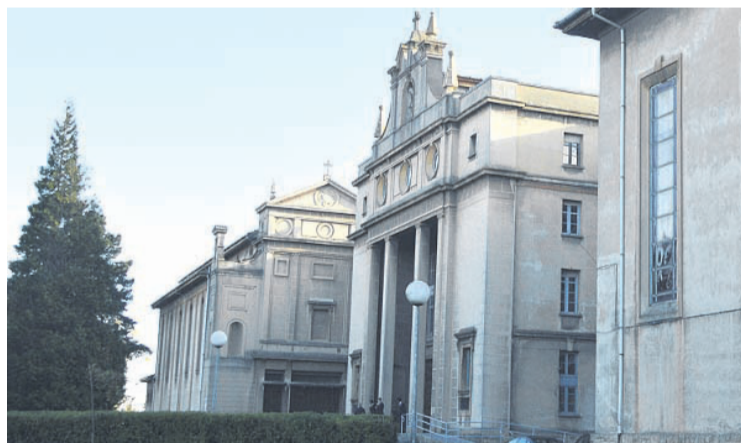
Seminario Metropolitano de Oviedo.