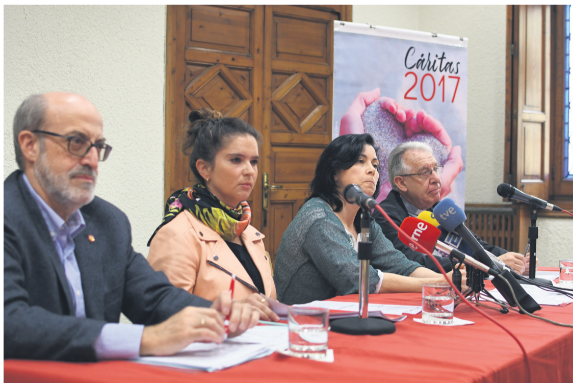
Un momento de la presentación, en la sede central de Cáritas Asturias.

Estas cifras podrían respaldar la recuperación económica de la crisis, pero desde Cáritas se contemplan con prudencia, al tiempo que se recuerda que 1.779 familias acudieron a solicitar la ayuda de esta institución por vez primera en el año pasado: “Más allá de cuantificar –destacan en la institución– lo que nos preocupa son los aspectos