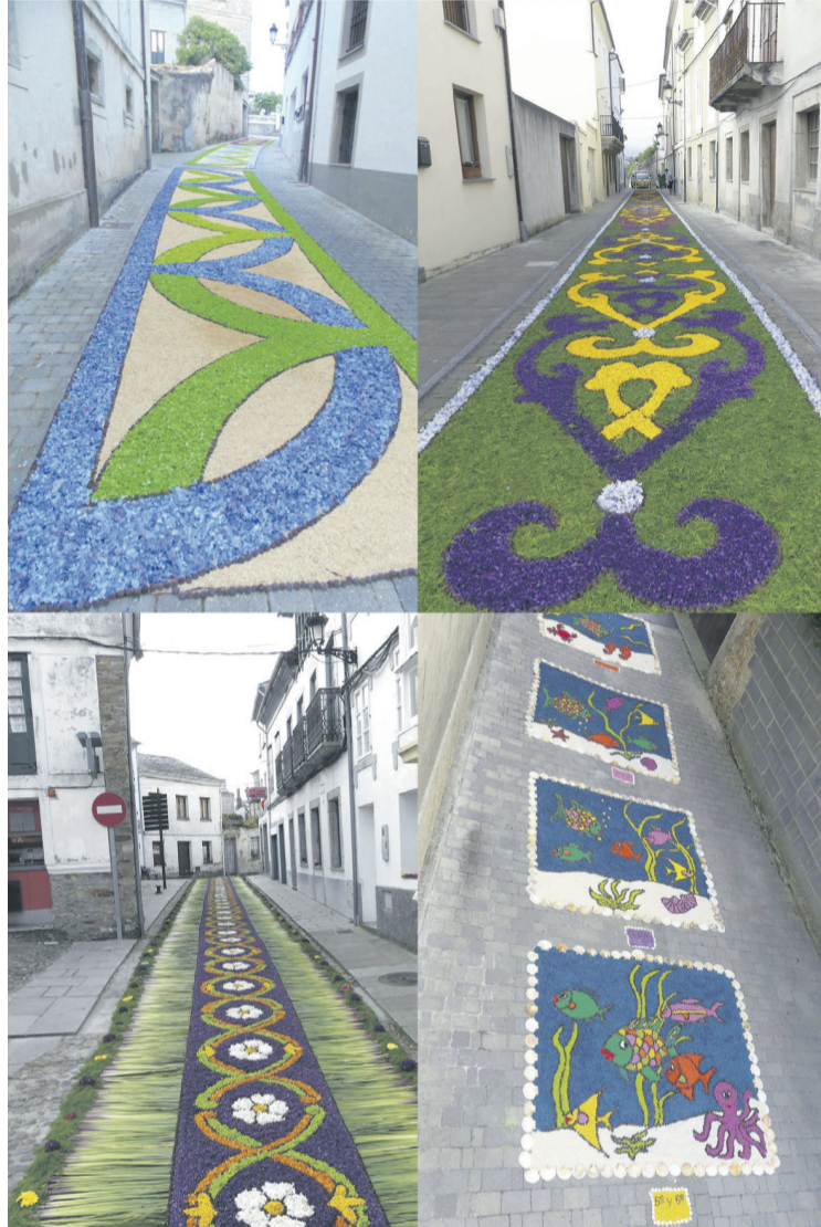
Detalles de algunas de las alfombras que adornan las calles de Castropol.

Año tras año la labor con las alfombras se ha ido perfeccionando y en 2008 se formó la Asociación Cultural El Pampillo que tiene como propósito aunar esfuerzos y organizar el trabajo a realizar, en el