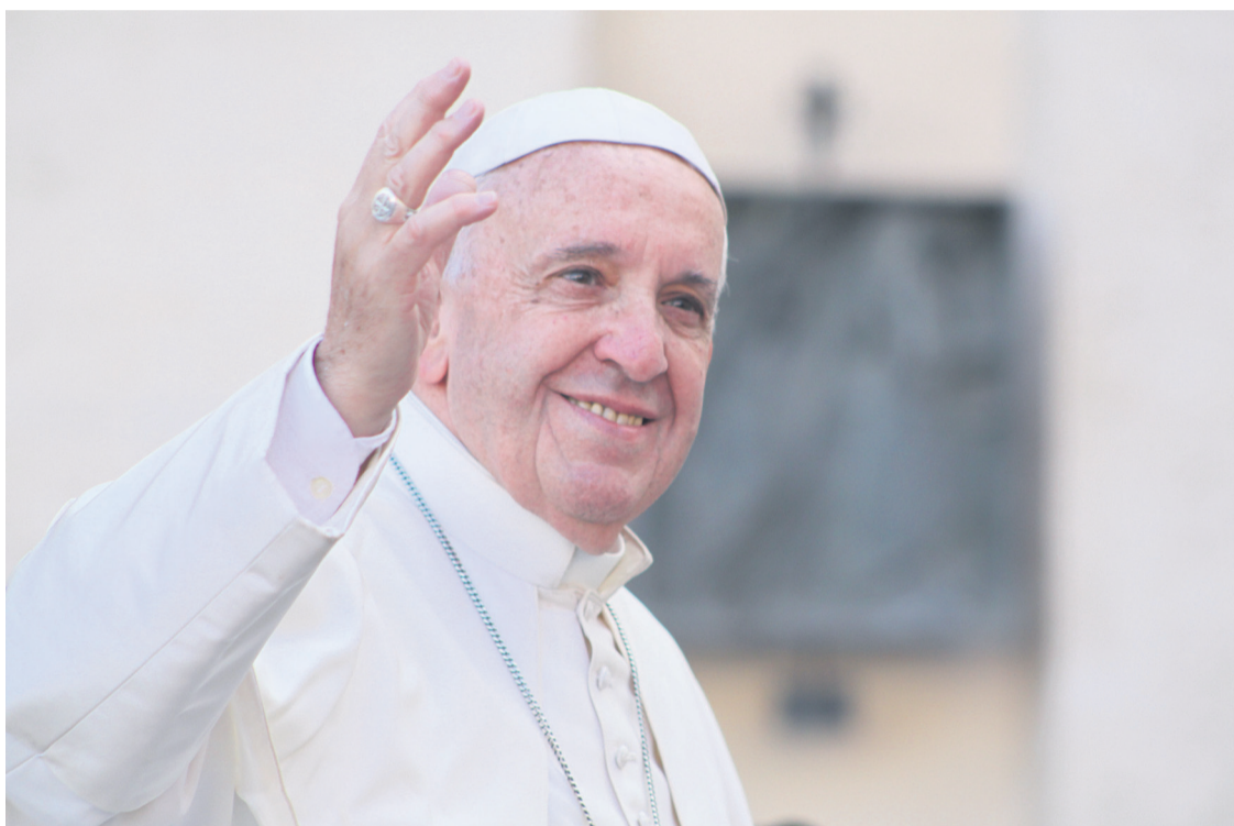
Mucho de lo que sugiere el Papa para ser santo es bien conocido: oración, frecuentar sacramentos, lectura del Evangelio.

Si por algo destaca el texto, es porque está dirigido personalmente a cada uno, sea cual sea su estado en la vida, nivel de educación o de desarrollo. La Exhortación es, además, deliberadamente “laica” en su lenguaje y en su invitación: está dirigida a personas que viven