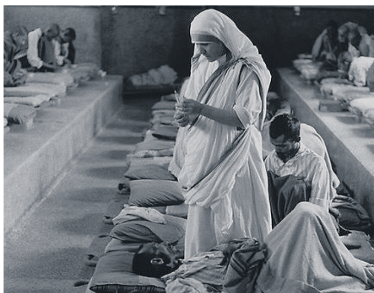
La Madre Teresa de Calcuta dedicó su vida a los “más pobres de entre los pobres”.

La exposición está compuesta de 56 paneles con fotografías y textos en español e inglés, ya que la primera vez que se mostró públicamente fue en la Jornada Mundial de la Juventud de 2011, en Madrid. Además, hay 28 paneles solo de fotografías que muestran momentos importantes en la vida y la obra de la santa albanesa, y los asistentes pueden observar además una réplica del cuarto de la Madre Teresa en La India. También, se habilita un pequeño oratorio al estilo de las capillas de las Misioneras de la Caridad, con un crucifijo, una