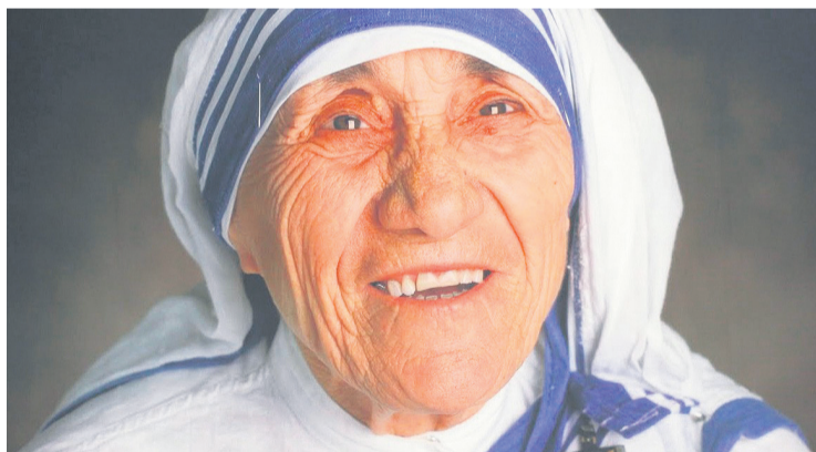
Santa Teresa de Calcuta.

Se trata de una exposición organizada por la familia de las Misioneras de la Caridad, y concretamente por el “Mother Teresa Center”, vinculado a su Causa de Canonización (la Madre Teresa fue declarada santa por el Papa Francisco el 4 de septiembre de 2016).