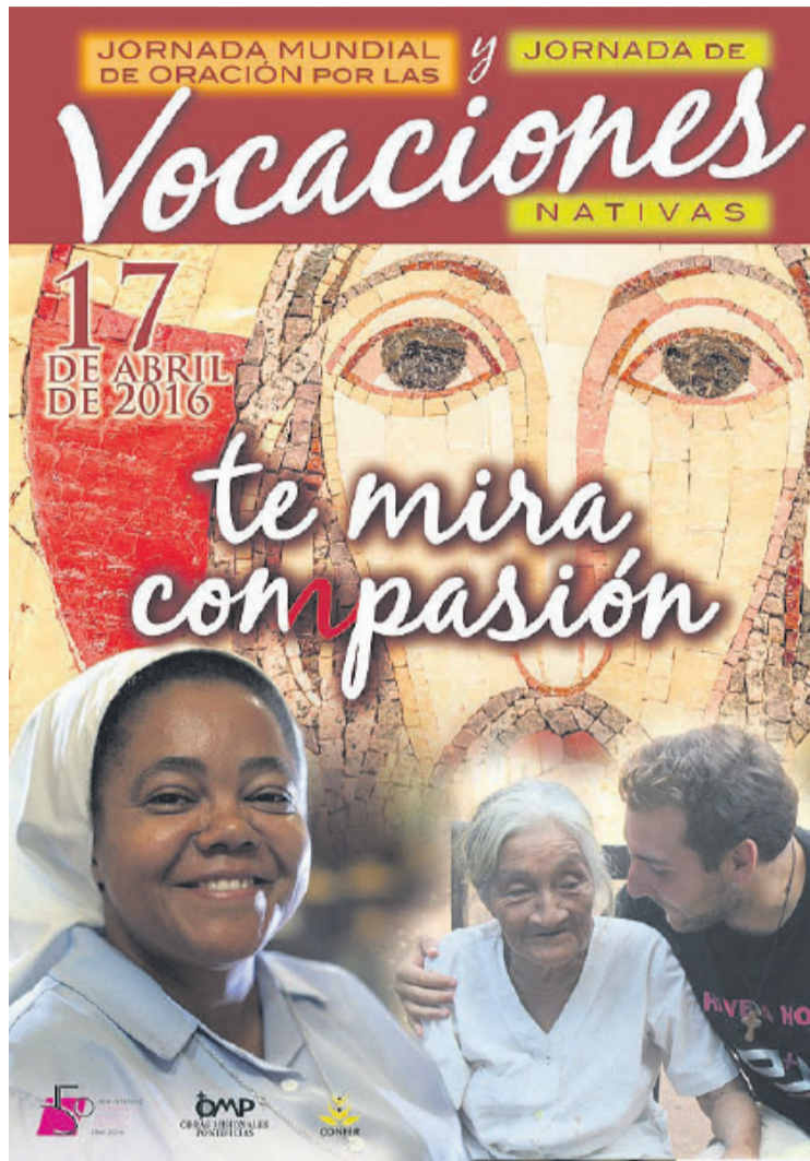
Cartel de las jornadas.