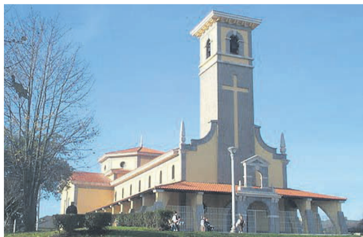
Iglesia de Santa Bárbara de Llaranes.

troamérica-, que en esta ocasión consistirá en financiar el proyecto Mujeres, agua y soberanía alimentaria , en Alta Verapaz. Y al mismo tiempo, la propia realidad de la parroquia y su entorno, donde la crisis y sus consecuencias lleva años marcando las últimas Semanas Solidarias. Ahora, además, se pondrá el acento en la emergencia de los movimientos migratorios, por lo que se han decidido a sensibilizar sobre la “construcción de