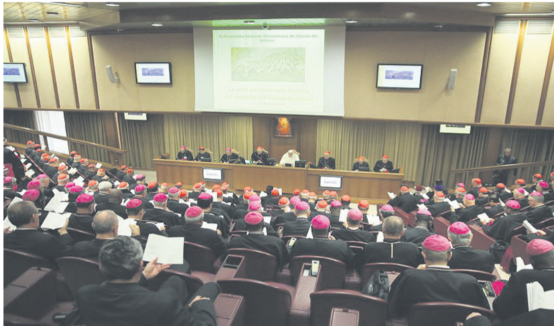
Una reunión del Sínodo de las Familias.

Entre los temas que más han estado presentes en el Sínodo se encuentra el de la importancia de