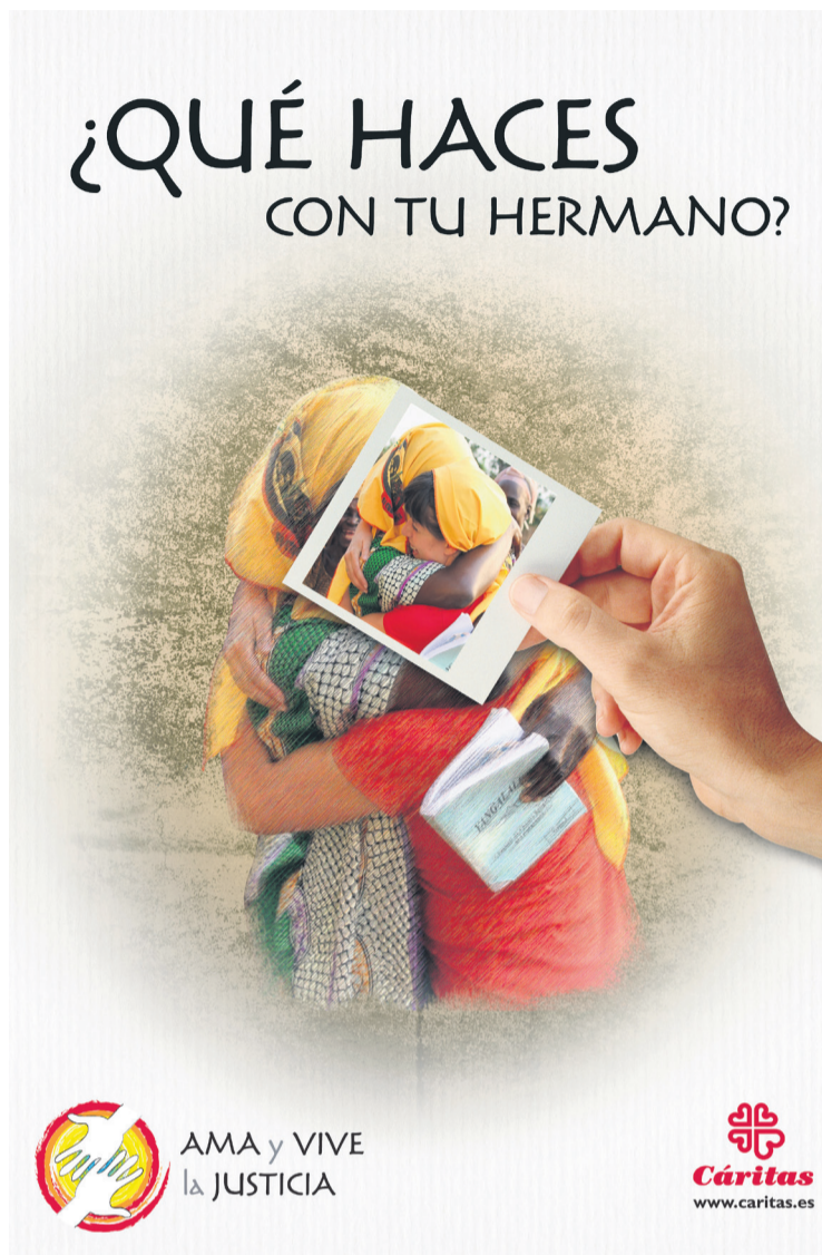
Cartel del Día de la Caridad 2015.

En este día, y porque una de sus obligaciones es la denuncia de las situaciones de injusticia, Cáritas Asturias recuerda a las más de 22.000 personas que atendió en la región, desde la red de acogida y acompañamiento en el año 2014, así como a las casi 1.900 personas sin hogar que acogen en sus centros. Además, Cáritas Asturias ha atendido a 935 personas en el ámbito de la inserción socio laboral; se ha acompañado a más de 1.600 personas mayores, y a 490 menores en diferentes programas de apoyo educativo, tiempo libre, etc. Todo ello, gracias a la labor de los casi 1.700 voluntarios, entre los que se encuentra el propio