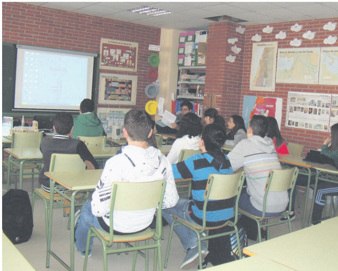
Un aula de Religión en un IES asturiano.