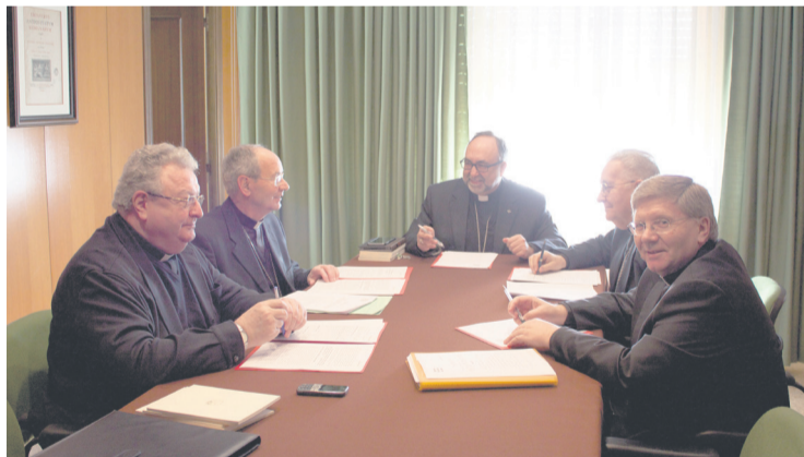
Un momento del encuentro, en la Casa Sacerdotal de Oviedo.

Además, repasaron la reunión bianual que tendrá lugar, el próximo mes de noviembre, en