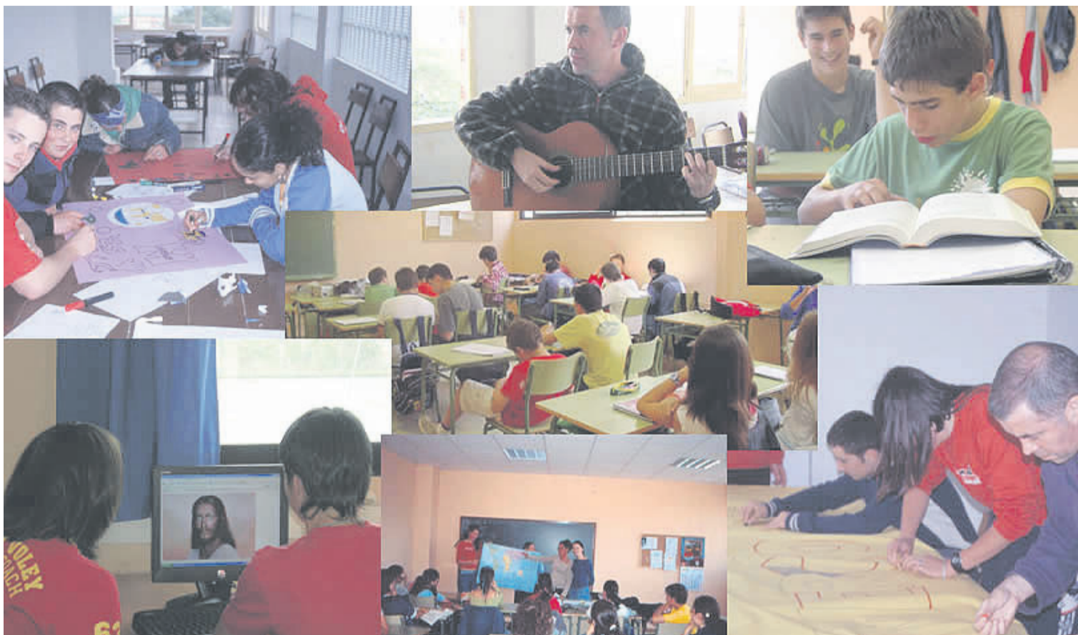
Diferentes momentos en las aulas de Religión de la escuela pública en Asturias.