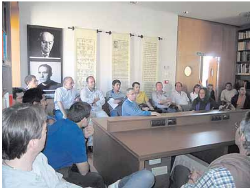
Alumnos y profesores de la Facultad de Burgos durante uno de sus encuentros presenciales