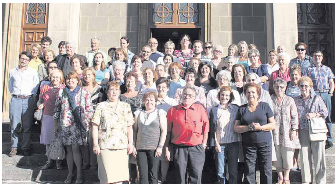
Catequistas asturianos asistentes a los cursos de Oviedo, durante la Semana de la Catequesis en el Seminario Metropolitano

Semanario de Información del Arzobispado de Oviedo • Director: José Emilio Díaz • 20 de septiembre de 2012 • Núm. 1094