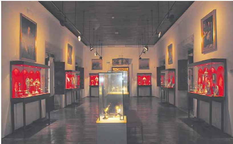
“El pan que da la vida”, sala cuarta del Museo diocesano dedicada a la Eucaristía