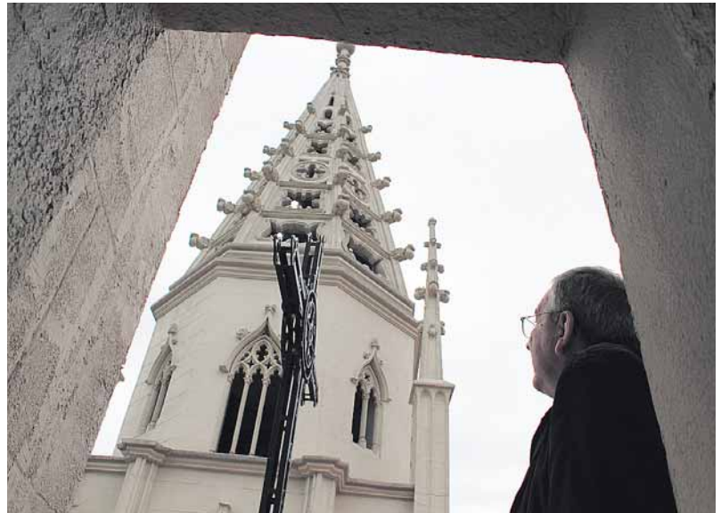
El párroco de Sama observa una de las torres de su iglesia recién remodelada

En todo el proceso el apoyo de una gran parte del pueblo ha sido