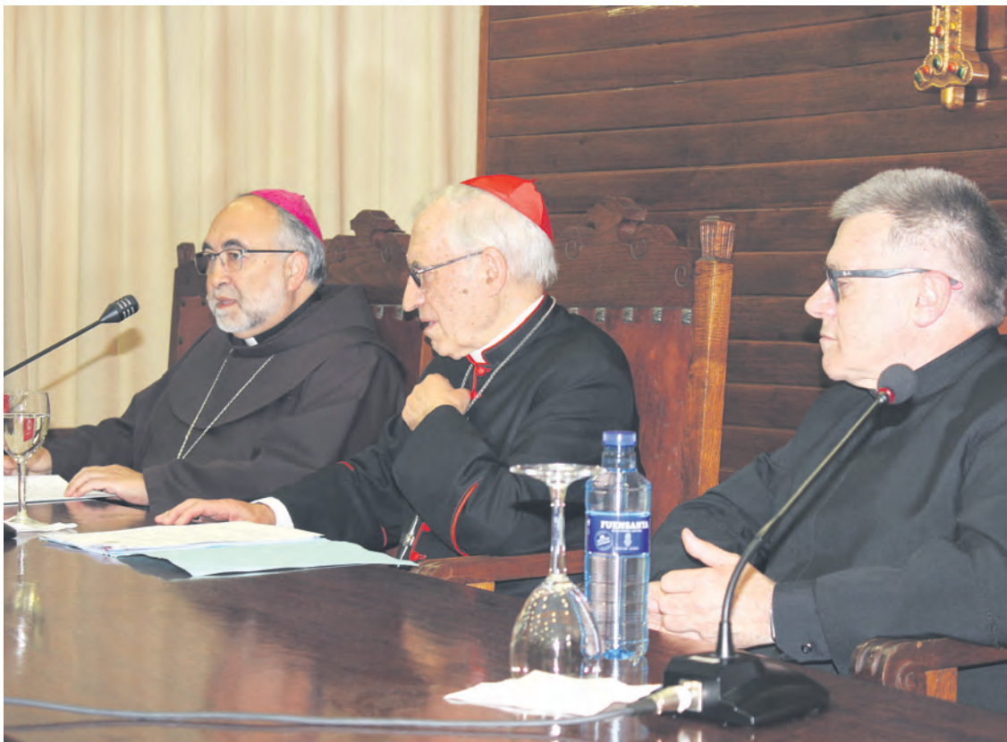
Clausura de las Conversaciones de Covadonga, con el Arzobispo emérito de Madrid, cardenal Antonio María Rouco Varela.