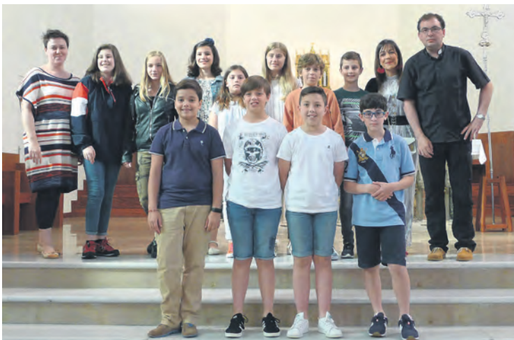
Los premiados en el certamen de redacción y dibujo vocacional.

que participaron en la quinta edición del Certamen de Redacción y Dibujo Vocacional, que este año tenía como tema principal el discernimiento. El planteamiento se hizo partiendo de la carta publicada para la consulta del Sínodo de los Jóvenes, desglosando los pasos que se plantean sobre el discernimiento vocacional, tomando como modelo San Juan Evangelista. A partir de esos pasos, los participan-